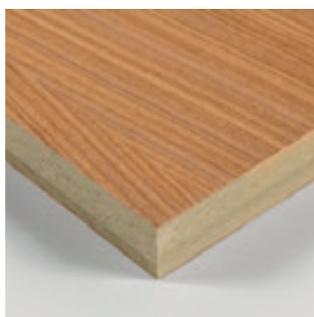
Afroformosia op V313 MDF