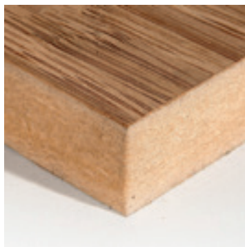
Bamboe fineer op MDF

Bamboe behoort tot de familie van grassen en is één van de snelste groeiers in het plantenrijk. Een snel groeier als bamboe kan in een aantal gevallen als “groen” alternatief voor de traditionele grondstof hout worden toegepast.