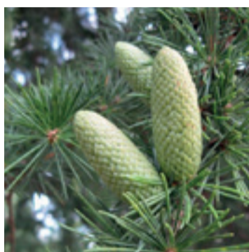
Ceder naald & vrucht