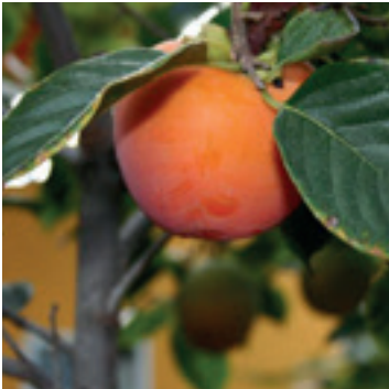
Ebben Afrikaans blad & vrucht