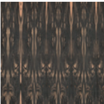
Ebben Afrikaans finer