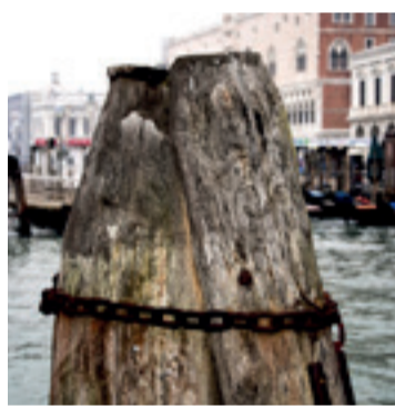
Meerpaal in Venetië