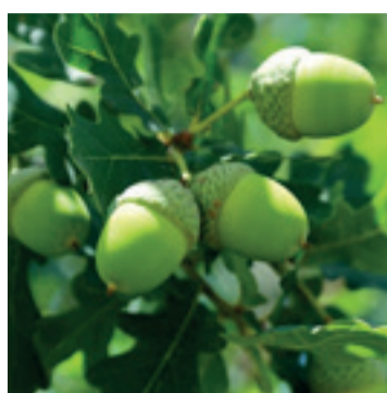
Eiken vrucht en blad