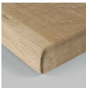
Massief rustiek eiken

Eiken rustiek wordt gekenmerkt door de aanwezigheid van kwasten, draadverloop, kleurverschillen en andere gebreken die in “foutvrij” eiken niet voor komen. Deze natuurlijke karaktereigenschappen zorgen voor een robuuste en landelijke uitstraling.