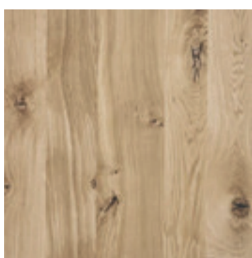
Eiken Rustiek fineer