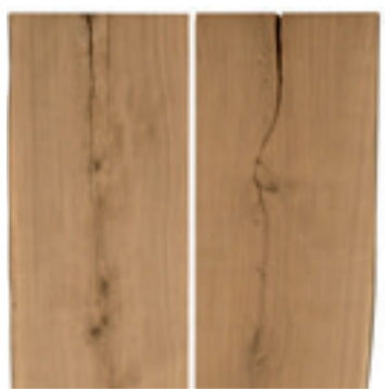
Rustiek eiken plaat