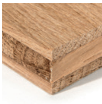
Rustiek eiken panelen