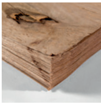
Rustiek eiken fineerboek