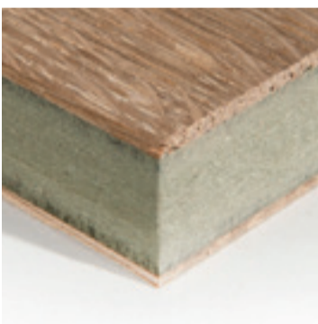
Eiken dik fineer