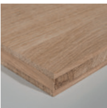
Eiken drie lagen plaat

Eikenhout is een verzamelnaam van meerdere eiken soorten uit de familie Fagaceae. De vier meest voorkomende eiken soorten met de botanische naam Quercus zijn: