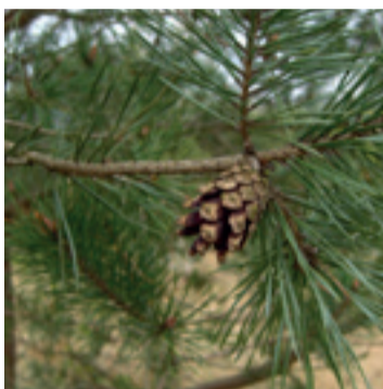
Grenen naald & appel