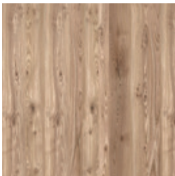
Rustiek iepen fineer