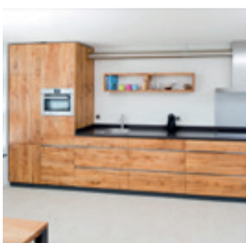
Keuken van iepen fineer

Iepen is een warme lichtbruine en ringporige houtsoort met een uitgesproken vlamtekening.