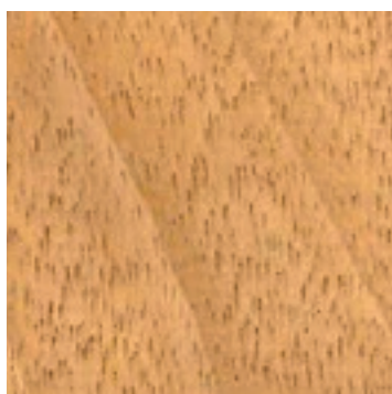
Kruisdraad iroko fineer