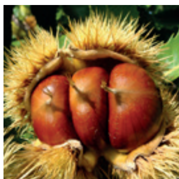
Kastanjes in bolster