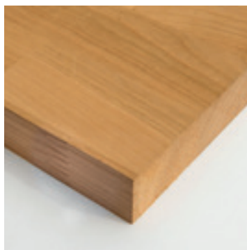
Europees kersen massief

Kersenhout is loofhoutsoort met een warme roodbruine kleur, herkenbare tekening en exclusieve uitstraling.