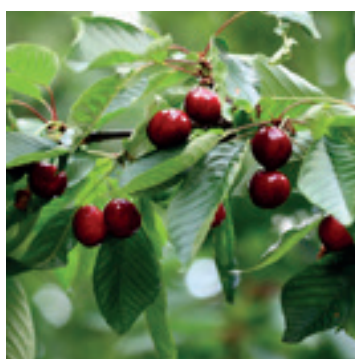
Kersen blad & vrucht