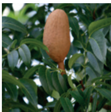
Mahonie vrucht & blad