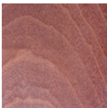
Mahonie finer dosse