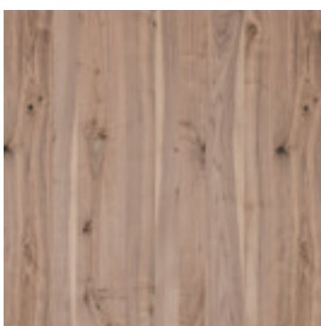
Noten Amerikaans spint