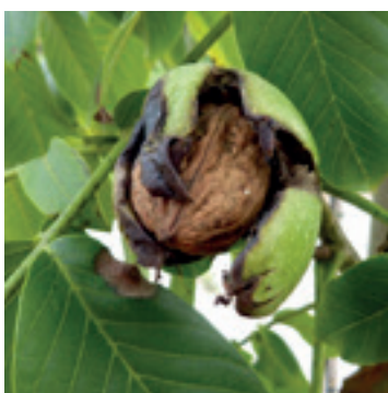
Noten Amerikaans blad & vrucht