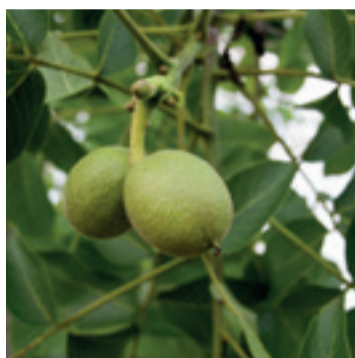
Noten Europees blad en vrucht