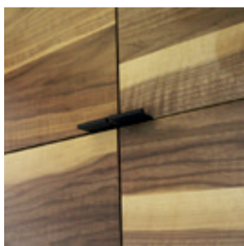
Noten Europees meubel

In Nederland wordt hoofdzakelijk Europees en Amerikaans noten verwerkt. Hoewel het in beide gevallen walnoten hout betreft zijn het twee verschillende houtsoorten uit één en dezelfde familie.