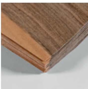
Europees noten fineerboek

In Nederland wordt hoofdzakelijk Europees en Amerikaans noten verwerkt. Hoewel het in beide gevallen walnoten hout betreft zijn het twee verschillende houtsoorten uit één en dezelfde familie.