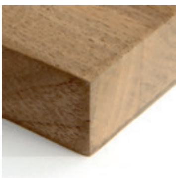
Europees noten paneel