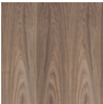
Europees noten fineer