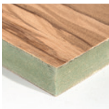
Olijf fineer op V313 MDF