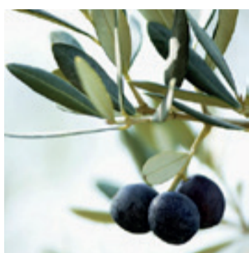
Olijf blad met vrucht