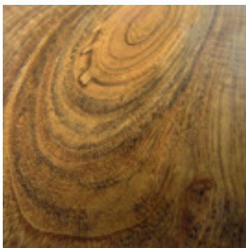
Ovangkol finer detail