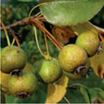
Peren blad & vrucht