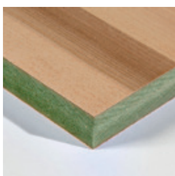
Redgum fineer op V313 MDF

Redgum is een houtsoort met een exclusieve uitstraling. Het geelwitte tot lichtroze hout heeft een zijdeachtige glans en kenmerkt zich door het bruinrode contrasterende kernhout. Dit kernhout komt hoofdzakelijk voor in oude bomen en toont een gelijkenis met notenhout, ondanks er geen botanische verwantschap is wordt redgum ook satijnnoten genoemd.