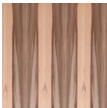
Redgum fineer boekvorm