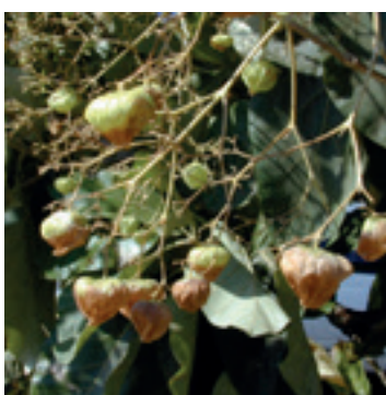
Teak vrucht en blad