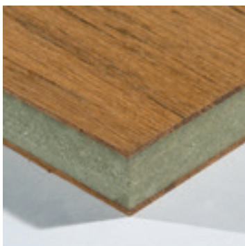
Teak dik fineer