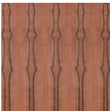
Tineo fineer in boekvorm