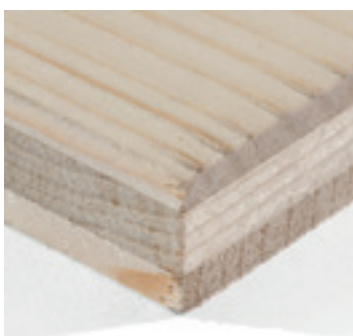
Vuren drie lagenplaat

Vurenhout is bleke geelbruine naaldhoutsoort die voor vele doeleinden kan worden toegepast. Het hout is van de fijnspar, bekend als de kerstboom, de botanische naam is Picea abies (L.) KARST (=P.excelsa LK.) uit de familie Pinaceae.