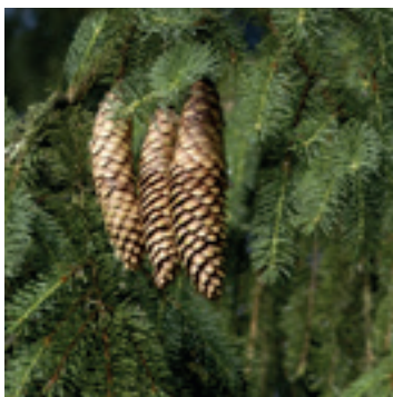
Naalden en vruchten